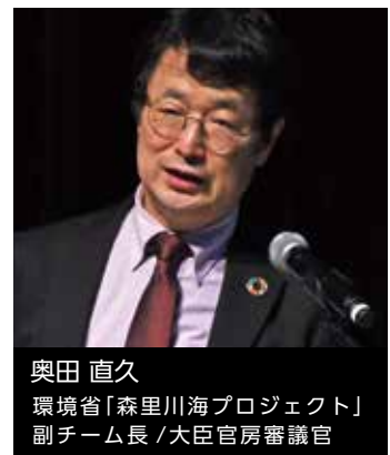
奥田 直久 環境省「森里川海プロジェクト」 副チーム長 / 大臣官房審議官