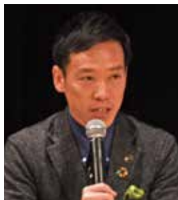
南出 賢一 泉大津市長