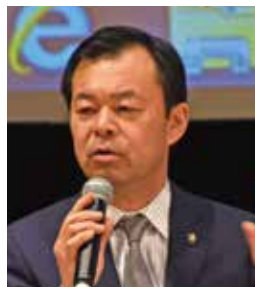
辻 宏康 和泉市長