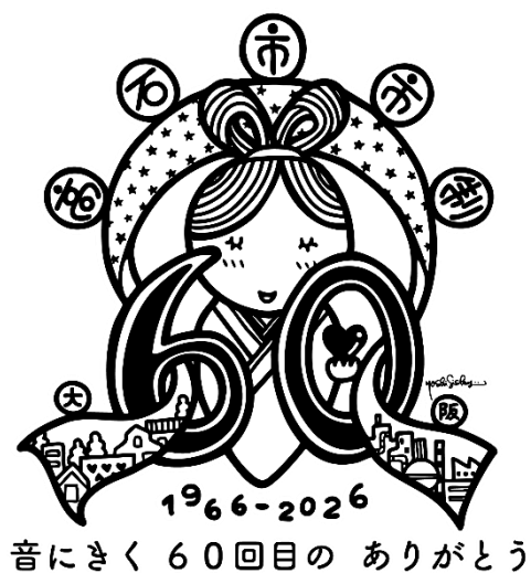
ロゴとキャッチフレーズ