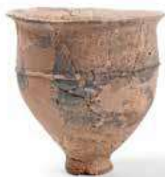
大園弥生集落で米作りが はじまった時に米などを 煮炊きした土器

近くの小さな谷あいのお米を くって暮らしていました。集落と水田のあ る景観は高石の原風景といえます。