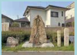
※書家・画家としても有名で京都相国寺の僧侶の石橋本獨山禪師に石碑の題字をいただきました。ぜひ足を運んでみてはいかがでしょうか。

現在では浜寺の地名や公園などを含め、わずかにその面影を残す限りですが、高石温故会のご尽力により蘇った「幻の大雄寺」は後世に受け継ぐべき高石歴史遺産の一つです。