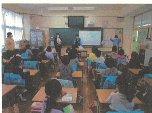
写真7. 交通安全教室（小学校）