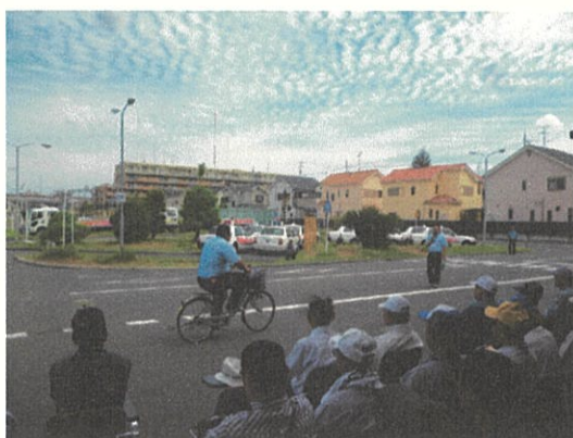
写真5. 交通安全体験教室