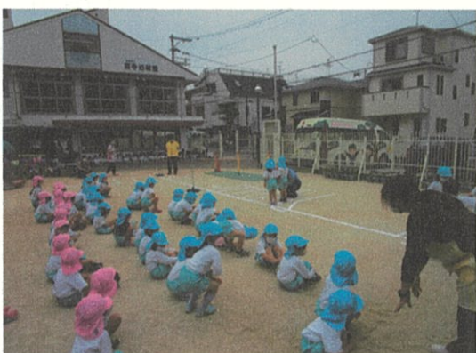
写真6. 交通安全教室（未就学児）