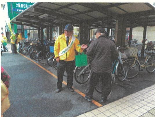
写真4. 自転車マナーアップキャンペーン

今後については、自転車通行空間整備に伴い、自転車安全利用五則を原則とした通行ルールの周知、徹底を図ります。