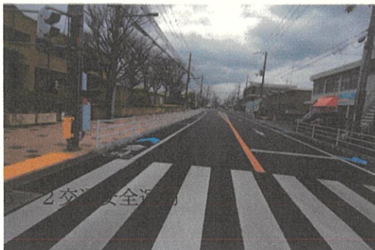
写真3. 市役所前通り