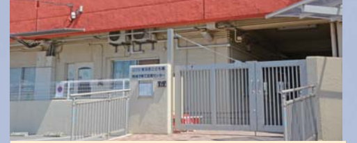
東羽衣こども園 東羽衣こども園子育て支援センター