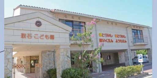
取石認定こども園