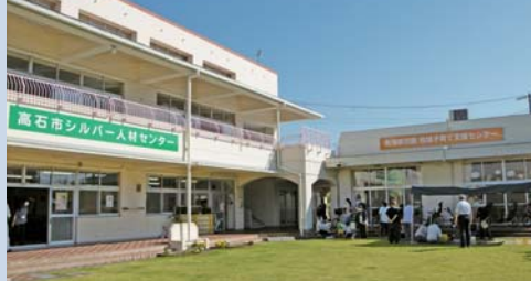
南海愛児園子育て支援センター