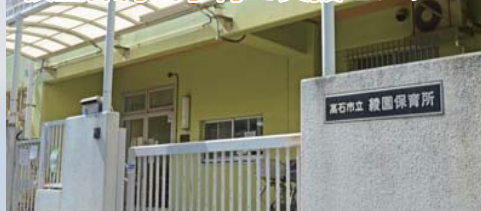
綾園保育所 綾園保育所子育て支援センター