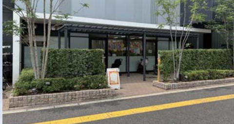
羽衣子育て支援センター