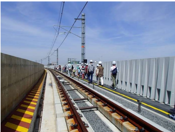
2016年に高石駅～羽衣駅で行われた 高架ウォーク

真横（南海本線）を列車が走行する高架上を歩くことができる「高架ウォーク」は貴重ですので、ぜひご応募ください。詳細は次のとおりです。