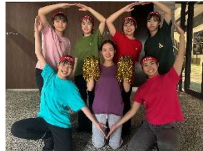
羽衣学園高等学校 ダンス部 美女桜(パーペナ)