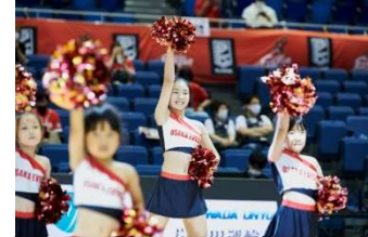
大阪エヴェッサ チアダンススクール bt's 臨海校

※スケジュールは、大阪・和歌山のおでかけ情報を発信する otent(おてんと)に後日掲載します。