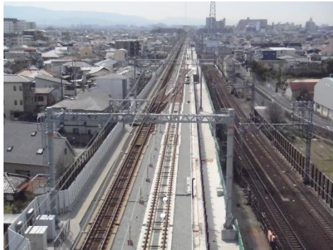
高師浜線高架化工事前（羽衣駅南側）