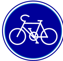
「自転車道」の道路標識