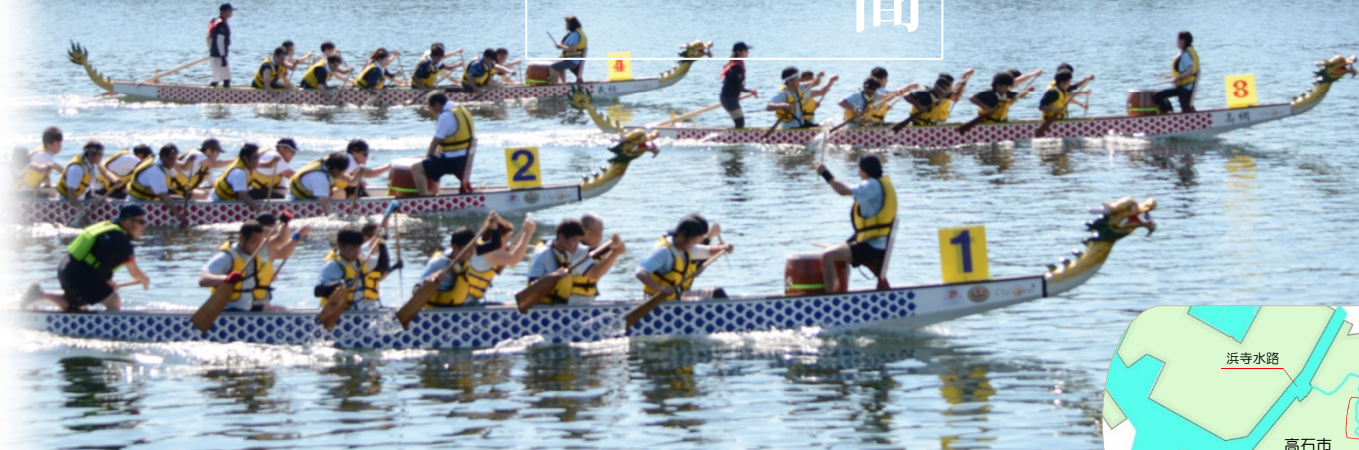
水質改善により市民のにぎわいの場に生まれ変わった浜寺水路 第8回堺泉北港スモールドラゴンボート大会の様子（大阪府高石市）