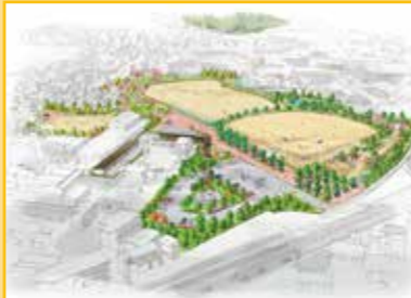
▲ 蓮池公園整備事業イメージ(市街化調整区域)

高石市 〒592-8585 高石市加茂4丁目1番1号 電話 (072) 265-1001 令和3年5月22日