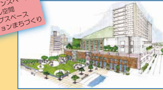
▲ 高石駅前の芝生化イメージ

キーワード ◆ 身近なオープンスペース ◆ ウォーカブル空間 ◆ コワーキングスペース ◆ リノベーションまちづくり