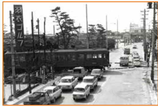
▲ 高師浜線一部高架工事【前】