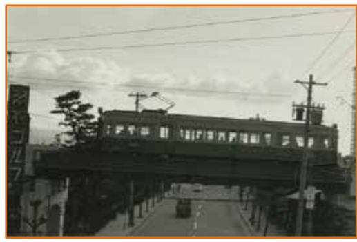
▲ 高師浜線一部高架工事【後】