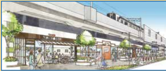
▲ 高架下活用イメージ