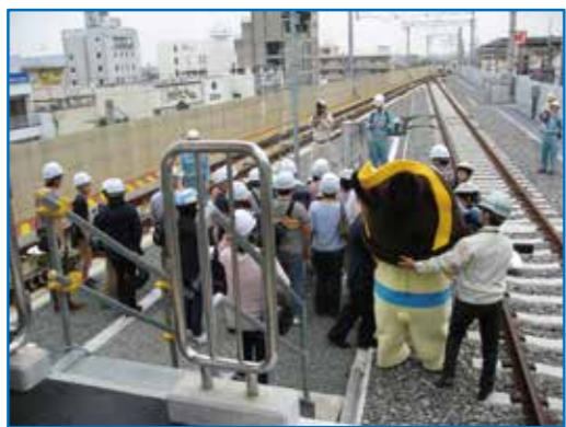
▲ 下り線高架工事完成内覧会