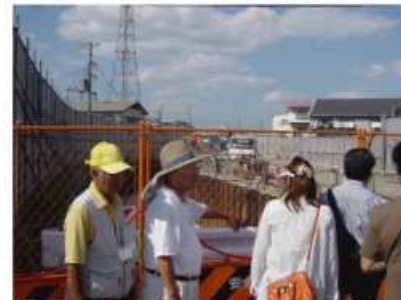
第2回川歩きワークショップの様子