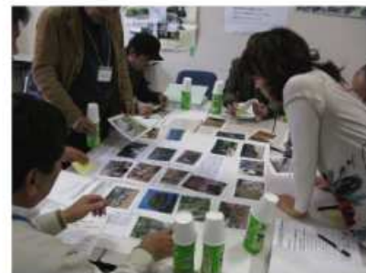
第3回ワークショップの様子