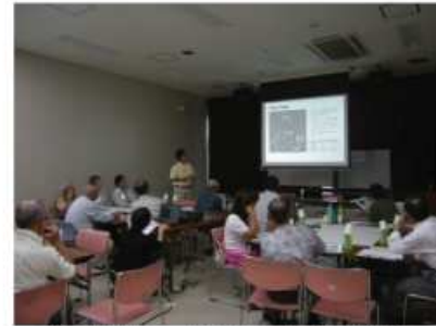
第1回ワークショップの様子