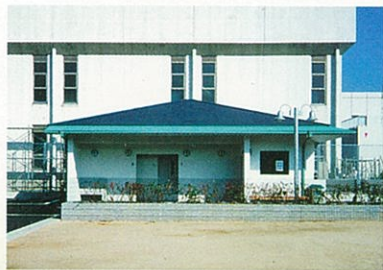
管理事務所・休憩所

※車でのお越しは大阪臨海線北行き方面（堺方面行き）から進入できます。 南行き方面（岸和田方面行き）からは、進入できません。