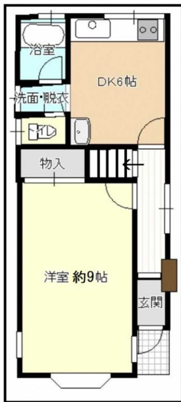
< 1 階 >